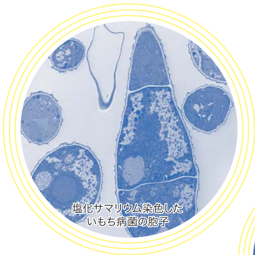
塩化サマリウム染色した いもち病菌の胞子