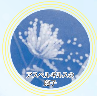
アスペルギルスの 胞子