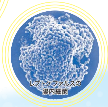
レプトケファルスの 腸内細菌